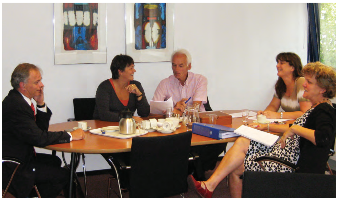
Werkgroep inhoudelijke aspecten en consequenties voor de zorgorganisatie